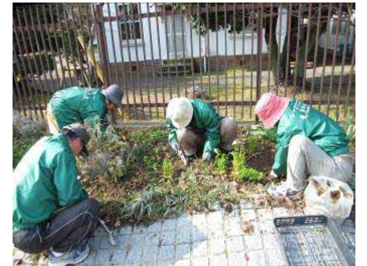
2月9日 ゆうゆうロード ムスカリの球根を傷付けないように草抜きをしました。

朝晩の冷え込みは、まだ続きそうです。体調管理には十分お気をつけて、3月も元気な花呼さんにお会いできるのを楽しみにしています。どうぞよろしくお願い致します。