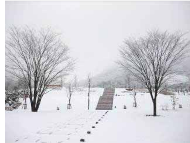
2月14日 市民集いの丘公園 公園はあっという間に真っ白になりました。