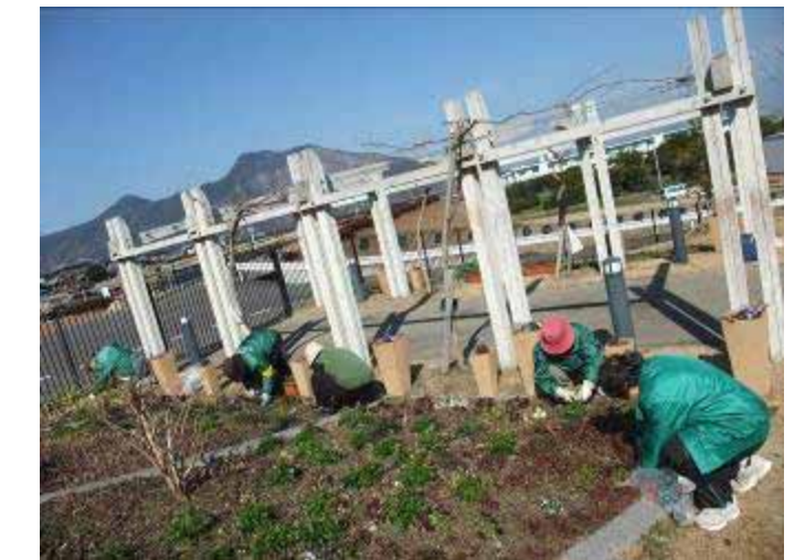
2月16日 市民花壇(吉原) 大雪の2日後。土はまだ凍っていました。 お花は、大丈夫かな??