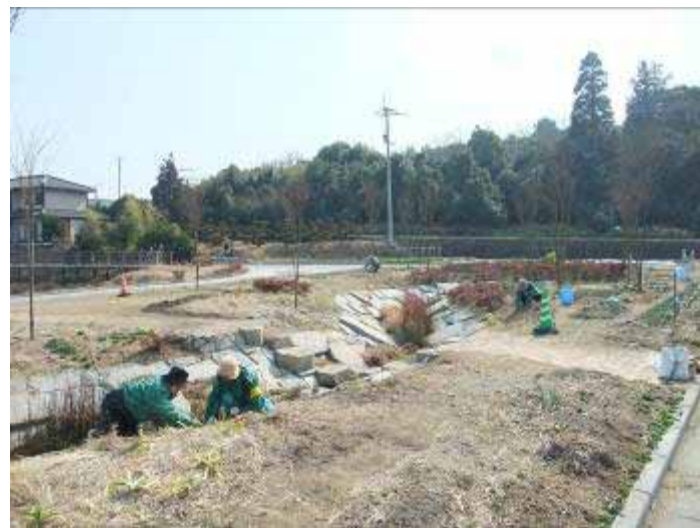
2月4日 地藏池 小さな草の芽がたくさん出ていました。

さて、そんな寒暖差が激しい2月。花呼さんの活動日は、というと3日間ともお天気に恵まれ、先月出来なかった花壇管理をすることができました。各地の花壇でチューリップやスイセンなど、球根の芽が目立ってくるようになりましたが・・・それと同じくらい草が勢いを出し始めてきています。球根の芽を傷付けないように間に生えた草を抜いていくのは、大変な作業ですが、皆さん丁寧に草抜きをしてくれました。活動場所を3ヶ所も移動する慌ただしい日もありましたが、お陰でしっかり見回りと管理をすることができました。本当にありがとうございました。