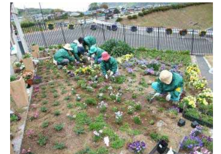
4月20日 市民花壇(吉原) 手分けして掘り上げや植え込みをしました。