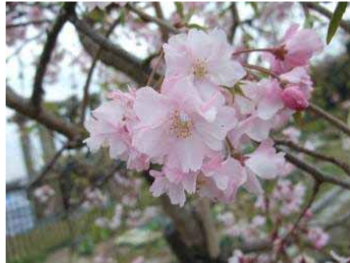
4月15日 地藏池 春といえば桜！シダレザクラが満開でした。

外に出かけるのも気持ち良くなってきた今日この頃ですが、皆さんはいかがお過ごしですか？4月は、気温が下がり少し肌寒い日もありましたが、各地で桜やチューリップが満開になり、お花見を楽しみながら活動することが出来ました。そんな4月の花呼さんの活動は、植え込み月間でした。急な雨で濡れながらの活動日もありましたが、皆さんのご協力のお陰で予定していた活動は全て行うことが出来ました。少ない回数にも関わらず、活動した花呼さんは延べ22名。活動時間を3時間設けている日もあり大丈夫かな？と心