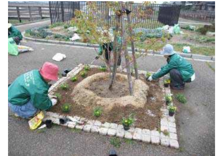
4月15日 地藏池 雨の降る中での活動。たくさんの苗を植え付けました。

では、5月も皆さんにお会いできるのを楽しみにしています。どうぞよろしくお願いします！