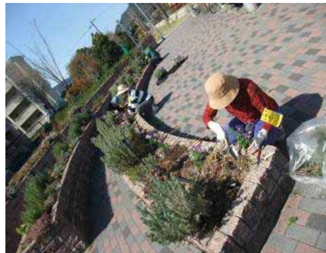
4月7日 丸山やすらぎ広場 花壇の植え替えを行いました。

配していましたが、たくさんの花呼さんにご参加頂き本当に感謝の気持ちでいっぱいです。丸山やすらぎ広場では、活動場所を移動する予定でしたが予定外の植え替えや草抜きなどすることがたくさんあり一ヶ所での活動となりました。地藏池では、新しく設置した大きな鉢にたくさんのお花を植え込みました。途中、雨が降って濡れてしまいましたが、皆さん手際よく活動を進めてくれたお陰で用意していた苗は全て植え込みすることが出来ました。市民花壇では、フラワー&ガーデンフェスタに向けて植え込みを行いました。小さなネメシアのこぼれ種やピオラの移植とこちらも忙しく急遽、午後からも来て頂き忙しい活動日となりました。