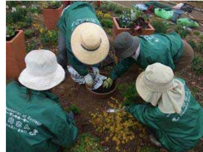
4月15日 地藏池 大きな鉢に寄せ植えを作りました。

穴を掘ったり土作りをしたりと今月は力の使う作業が多く大変でしたね。皆さん本当にお疲れさまでした。そしてありがとうございました！