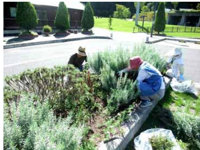
9月6日 鉢伏ふれあい公園