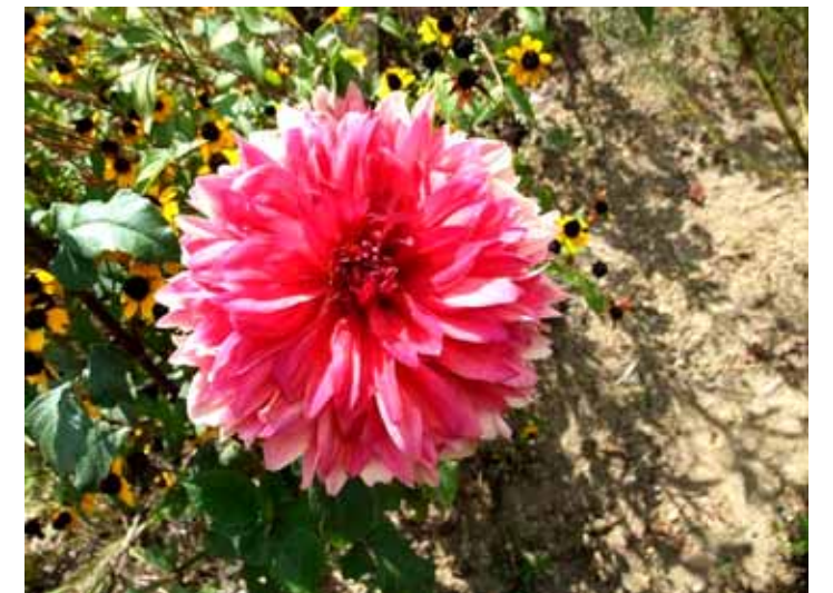
9月13日 地蔵池 ダリア

そして、みなさんお楽しみ、秋の見学会も開催します！今回は秋を探しに、高知県へ参ります。行ったことのある方も多いかもかもしれませんが、たくさんのご参加お待ちしております！では、10月もみなさんにお会いできるのを楽しみにしています。