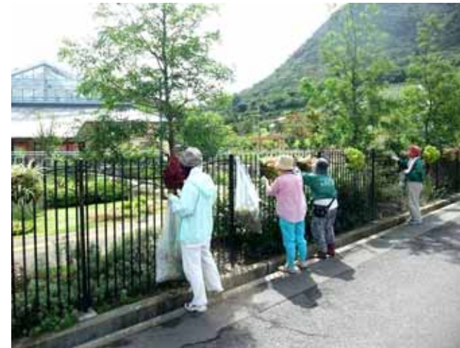
9月22日 市民集いの丘公園 フェンスにかかったハンギング 手入れしてもう一花咲かせます！