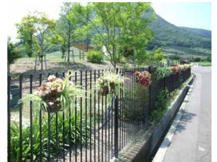
7月27日 市民花壇(吉原) お手入れ後のハンギング。 ペゴニアとオリヅルラン。どちらも暑さに強く、涼しげな印象。今が見ごろです。