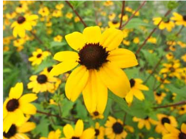
7月6日 鉢伏ふれあい公園 ルドベキアが満開になっていました。 元気が出る黄色です。

そんな中での7月の活動。6月に雨天中止で活動できなかったところは、やっぱり草だらけ。手分けしてどんどん草抜きを行