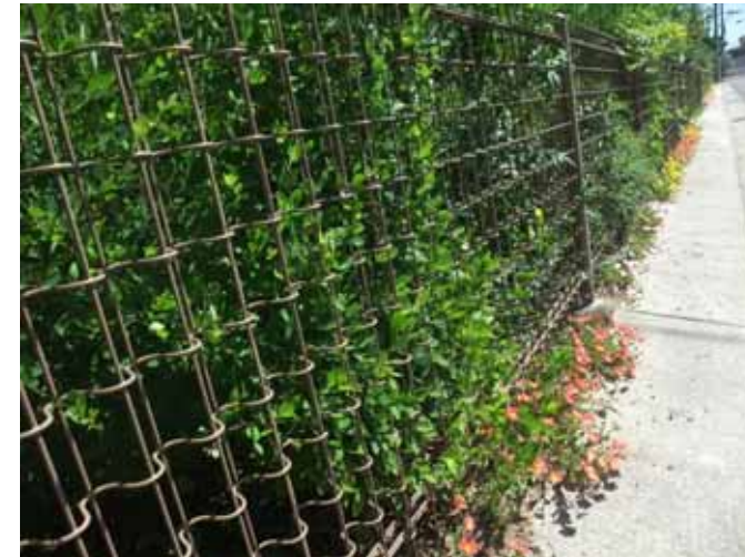
7月18日 カナン子育てプラザ21 フェンス沿いに植えたポーチュラカ。 きれいに咲きそろいました。