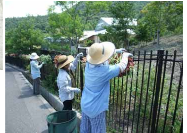
7月27日 市民花壇(吉原) フェンスにかけたハンギングをお手入れ。