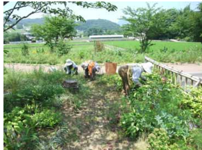
7月10日 地蔵池 活動がなかなかできず、草だらけになってしまいました。 なんとか手分けして草抜き。

梅雨が明けてからは、ほとんど雨が降っていないので、植物もカラカラになりそうです。皆さんもご自宅の水やりが忙しいかもしれませんね。8月の活動では、状態によって水やりも行いたいと思います。