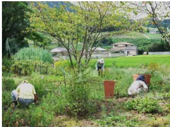
9月6日 地蔵池 草抜きをしていると、ここの土が本当にフカフカで、最初の頃とは別の場所のようにいい土になったと実感します。

フェンス沿いのハンギングもコリウスは元気でしたが、ペゴニアはちょっと株の傷みが激しくなってきたようです。作ったのが5月ですから、そろそろ疲れてくるころですね。