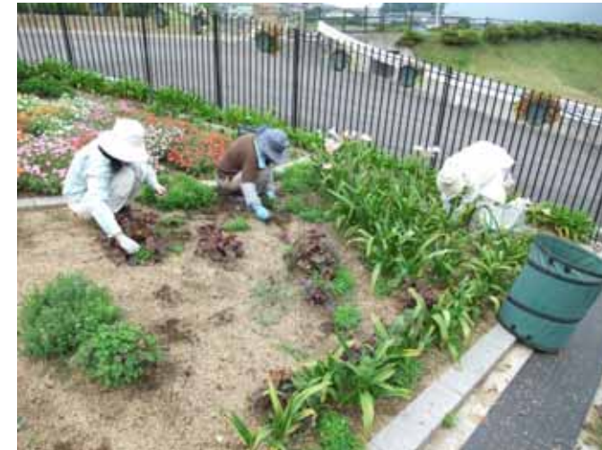
9月14日 市民花壇(吉原) 写真の右側に見えるのはアマクリナム。 ピンク色の大きな花が咲きました。