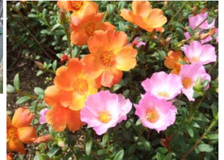
9月14日 市民花壇(吉原) ポチュラカも満開。 カーペットのように広がりました。

たくさんの花呼さんにお会いできるのを、楽しみにしています！ では、10月もよろしくお願いします。