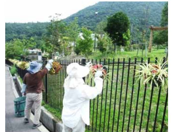
9月14日 市民花壇(吉原) 植え替えまであと2か月。 なんとか頑張ってもらいたいと思います。