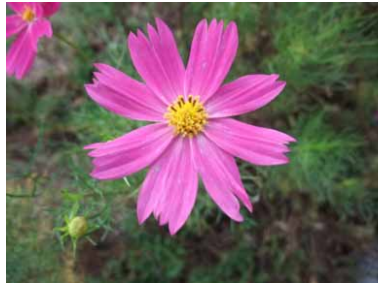
9月6日 地蔵池のコスモス 満開になるのが楽しみです。

とはいうものの、今月は雨天などの影響もあり、活動は2回のみ。ちょっとさみしくはありましたが、しっかりとお手入れできました。