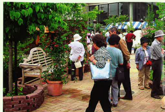
会場装飾:小松ガーデンデザイン