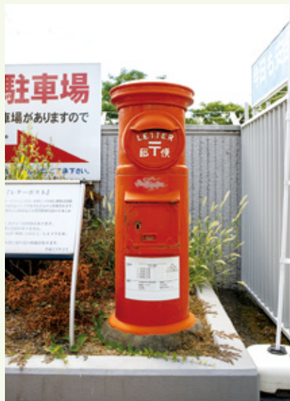
旅の便りを出してみたくなるレターポスト