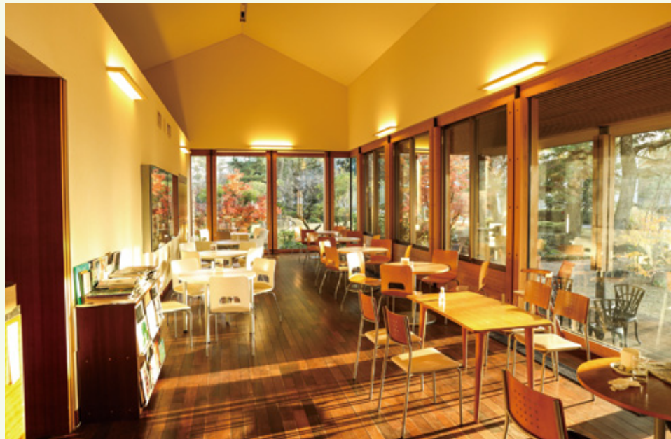
陽当たりのよい開放的な空間