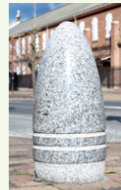
砲弾の形状の車どめ