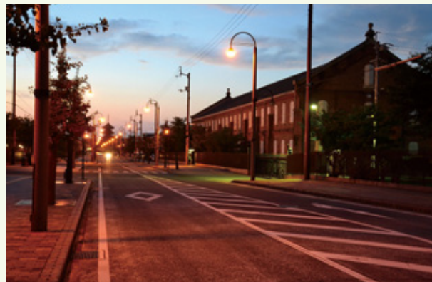
夕暮れ時のゆうゆうロードと赤レンガ倉庫

歴史を感じさせる情感漂うゆうゆうロードは、善通寺市の旅情を象徴するスポットとして、「みちくさ遍路」の表紙にも採用しています。善通寺市の魅力が凝縮された風情豊かな散歩道をぜひ歩いてみてください。