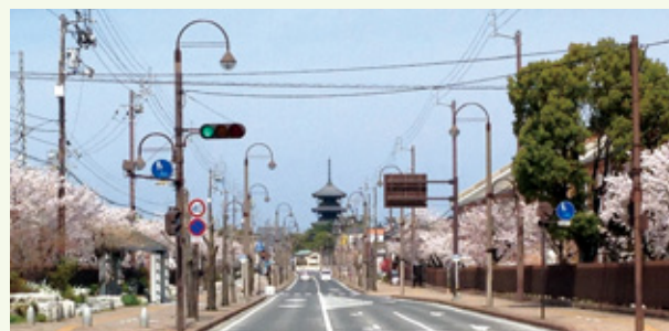
花びら舞い散る春の風景