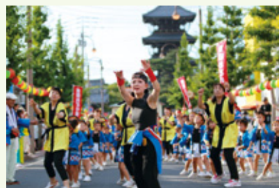
夏の風物詩「善通寺まつり」