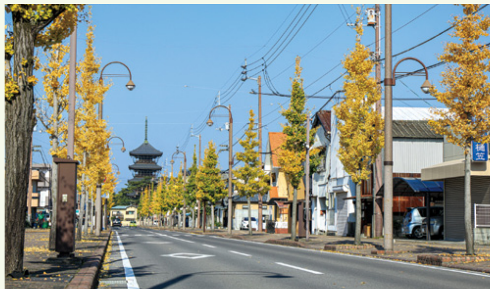
黄金色に染まるゆうゆうロード

総本山善通寺の南大門から陸上自衛隊善通寺駐屯地へ抜ける通りは、市民憩いの散策コースとして「ゆうゆうロード」と名付けられました。善通寺市のシンボリック建造物である五重塔を背景に、旧陸軍第11師団の兵器庫として造られた赤レンガ倉庫、季節によって色彩が変化する約80本の銀杏並木など、整備された街並みと歴史的建造物を一同に望むこ