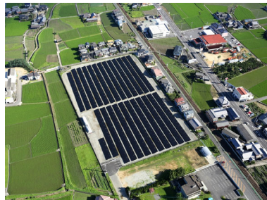
ぜんつうじ大麻太陽光発電所（大麻町）