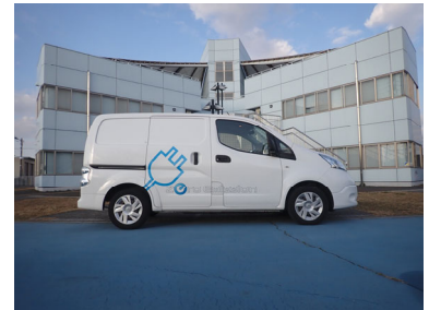
電気自動車（公用車）