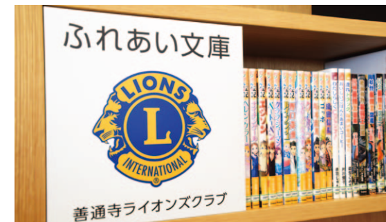
絵本・児童書などの図書 約560冊 (市立図書館、子どもライブラリー)