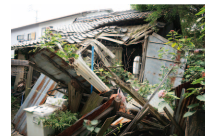
▲過去に除却支援を受けた家屋の一例