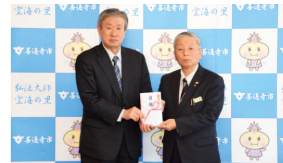
絵本・児童書などの図書 約170冊 (市立図書館、子どもライブラリー)