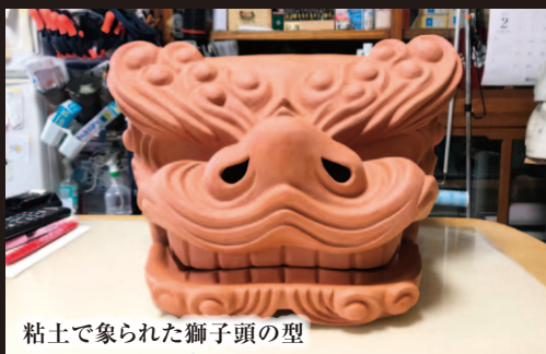
粘土で象られた獅子頭の型