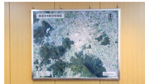
善通寺市航空写真図(4階 正副議長室)