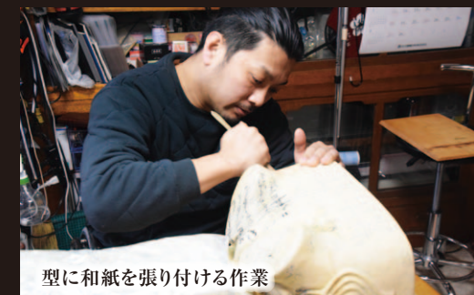
型に和紙を張り付ける作業

仕上げの獅子頭に漆を塗る作業は、何層にも漆の種類を変えながら塗り、きれいな曲線美もフリーハンド（職人技）で仕上げられています。