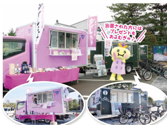
前方:キッチンカー(特産品販売など)

商工観光課 ☎63-6315 ✉shoukan@city.zentsuji.kagawa.jp