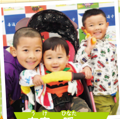
うけ ひなた 有家 暖ちゃん