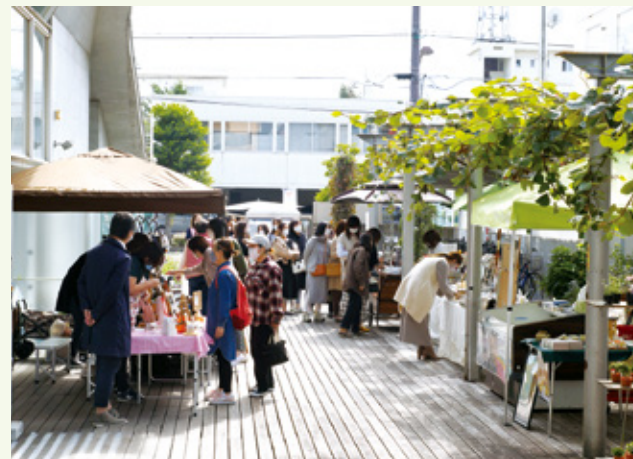
マルシェには多くの人が集まります。