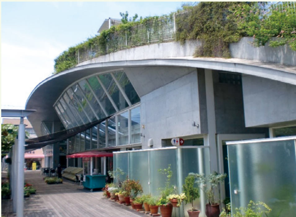
おしゃれな外観が目を引きまます。