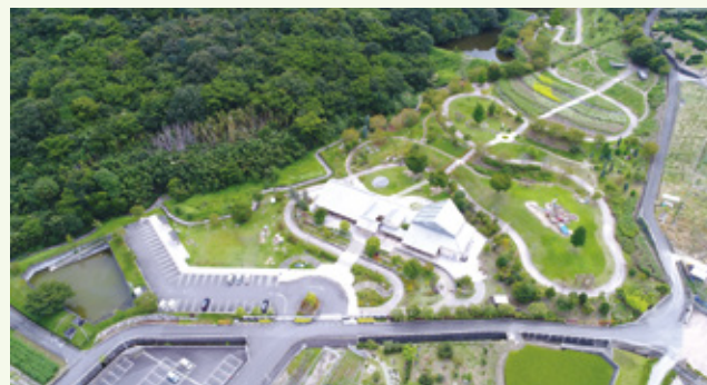
上空から見た市民集いの丘公園