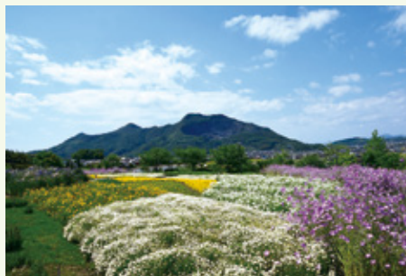
五岳山を背景に広がる花畑