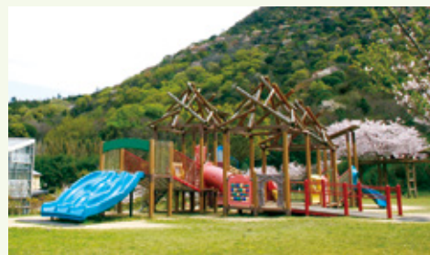
子どもたちに大人気の遊具