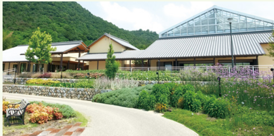
五岳山の麓に広がる公園です。