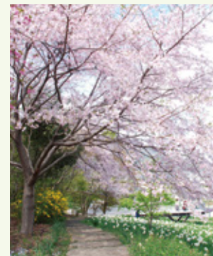
春には多くの方が花見に訪れます。