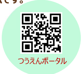
つうえんポータル

愛称「つうポ」は、こども誰でも通園制度を利用するためのシステムです。 スマートフォンやパソコンで簡単に操作ができます。