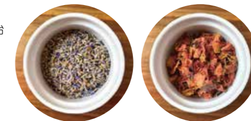
リラックス効果のラベンダー

*予約が混雑した場合、受付後、参加の確定について改めてお電話させていただきます。