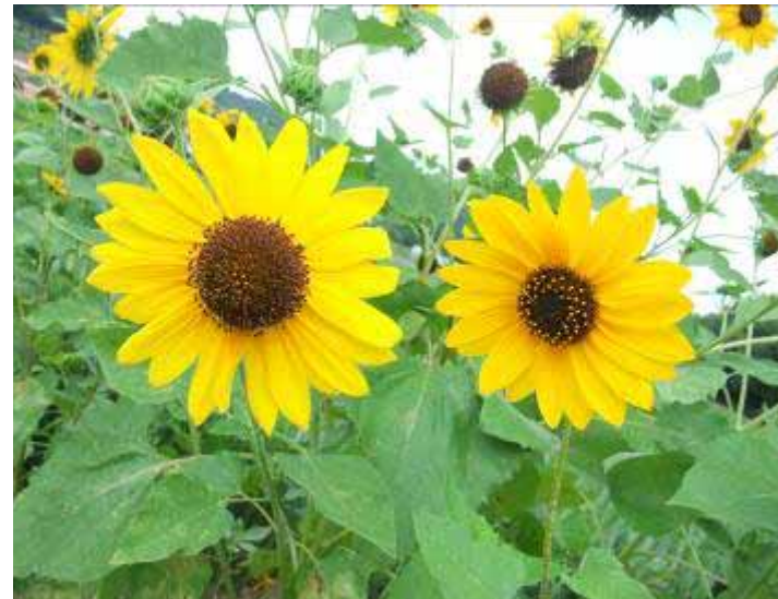
7月15日 地藏池 満開のひまわりが出迎えてくれました。

7月は、梅雨明けしてから台風や集中豪雨などの影響で雨の日が多かったですね。花呼さんの活動も、残念ながら雨天中止があり2回と少なかったですが、皆さんのご協力のお陰で十分な活動ができました。「暑いね～!暑いね～!」といいながらも決して手を止めない花呼さん。暑さに耐えながら花壇管理を中心に活動を行いました。春に植え込みした花壇は、そろそろお花の見頃も終わる時期。それでも切り戻