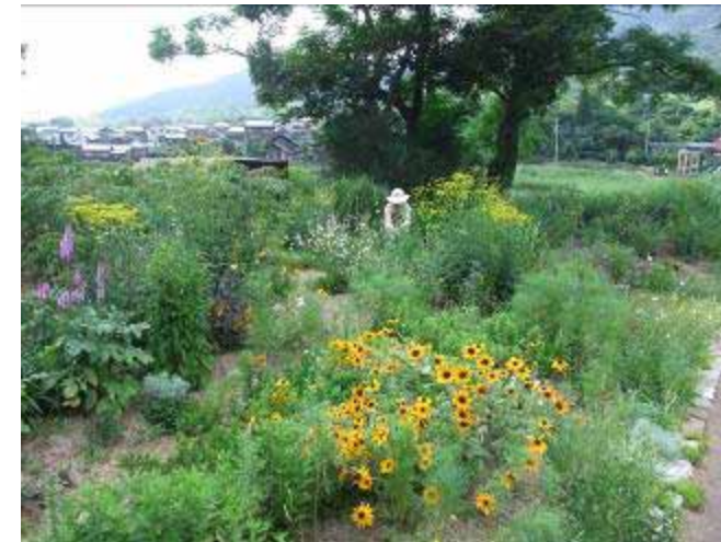
7月15日 地藏池 たくさんのお花に囲まれて 草抜きや花がらつみをしました。

また、先月の花呼だよりでもお知らせしたハンギングバスケットの花がらつみもしました。暑さに負けず順調に育っているハンギング。是非、公園へ見に来てください