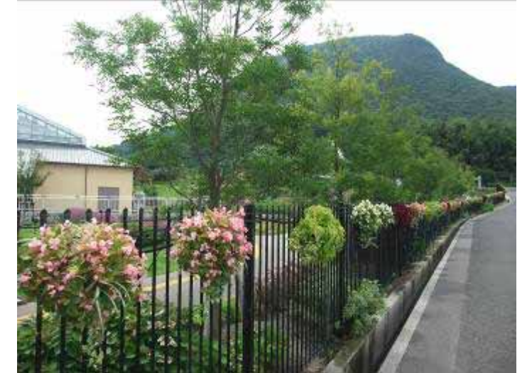
7月27日 市民花壇(吉原) 見事に咲き誇ったハンギングバスケット! 見頃を迎えています。

体調管理には十分注意して無理をせずにご参加ください。参加される場合は、各自、熱中症対策をよろしくお願いいたします。 それでは、8月も元気な皆様にお会いできるのを楽しみにしています。 どうぞよろしくお願いいたします!