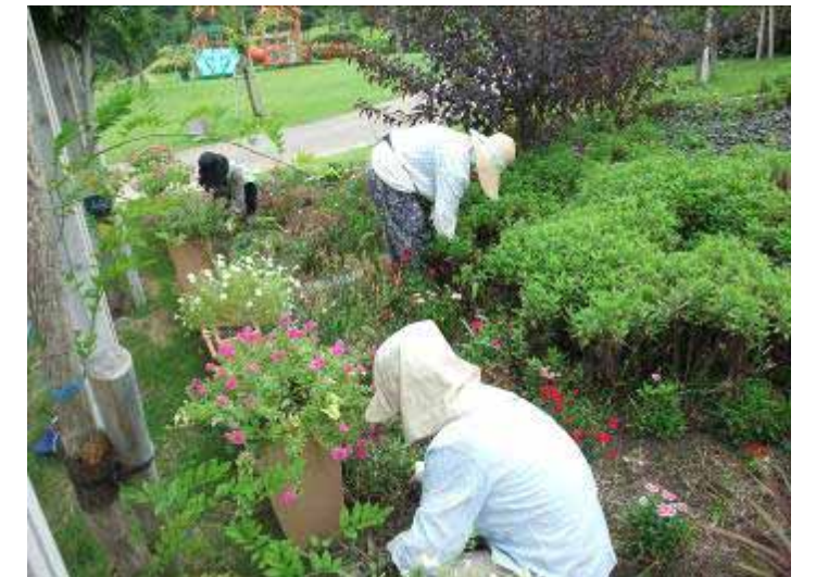
7月27日 市民花壇(吉原) たくさんのお草を手分けして抜きました。