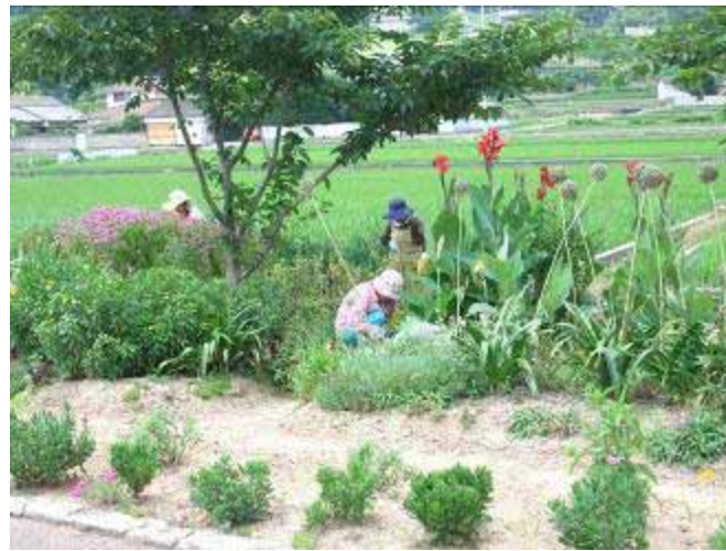
7月15日 地藏池 木陰を探して、草抜きをしました。

したお花がまた元気に咲いているのを見ると嬉しくなります。それと一緒に抜いたはずの草もまた勢いよく芽を出し、せっかく咲いたお花を隠すほど生長していました。どこから手を出せばよいのか悩むくらい雑草の勢いはすごいですね。地藏池での活動は、地元の花呼さんが毎日、大切に管理をしてくださっているたくさんのお花に囲まれながら、草抜きや花がらつみをしました。大きな害虫被害は今のところ出ていませんが、毛虫や蚊などたくさんの虫とも出会いました。市民花壇では、「草かな?お花かな?」と花壇を覆っている緑を確認しながら、間に生えた草を丁寧に抜きました。