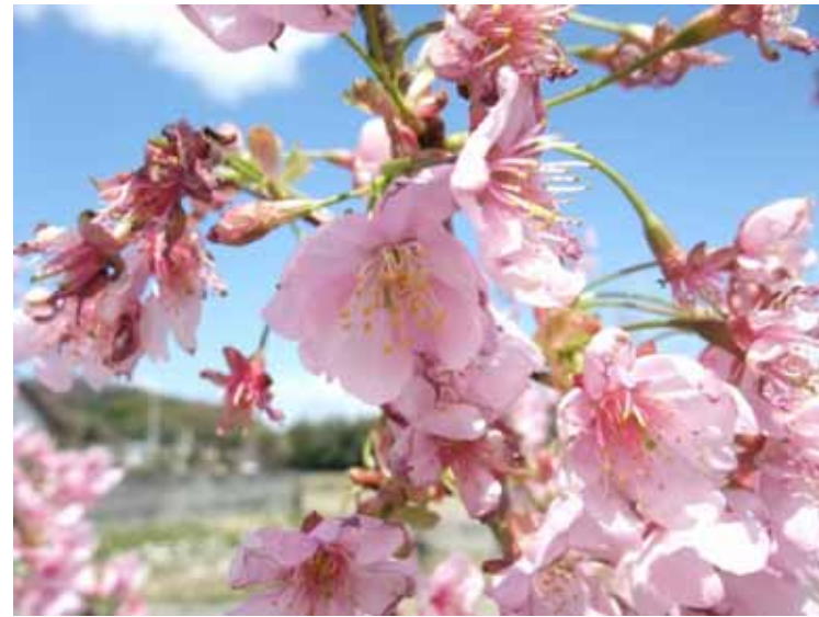
4月6日 地蔵池 サクラが開花 お楽しみの春スタートですね。

冬の装いから一気に色づき始めるこの季節。心待ちにされていた方も多いことと思います！なんととっても花を呼ぶ「花呼さん」！皆さんが呼んだおかげか、たくさんのお花が、あちこちで一気に咲きだしました。こうなると、やっぱり活動も忙しいけど、楽しくなりますね。あ、こんなところにこんなお花が！とかまた今年も咲いてく