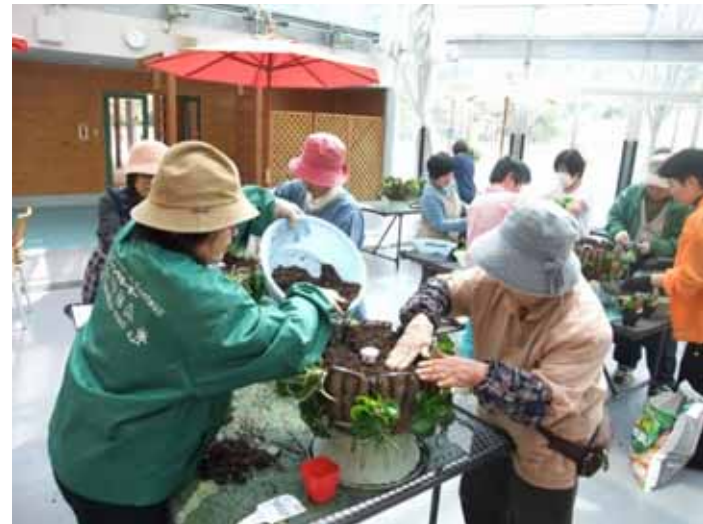
4月17日 市民集いの丘公園 園内に飾るスタンド型ハンギングバスケットを作成

さて、そんな4月の活動。各地でよく咲きだしたピオラなどの花がらつみや草抜きなどを中心に活動しました。また、4月17日には、市民集いの丘公園でスタンド型ハンギングバスケットの作成を行いました。ハンギングバスケット協会のマスターさんの指導の下、大きなバスケットに向かい合って順番に植えこんでいくのは、ちょっと大変だったようですが、皆さん丁寧に作成していただけたので、見事なバスケットになることと思いま