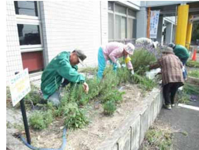
4月19日 こどもセンター 大きくなったラベンダーを一齐に切り戻し。

4月25日 市民花壇(吉原)(下・最下) 一齐に咲きだしてにぎやかになった市民花壇。 花がらつみも草抜きも大変になってきました！