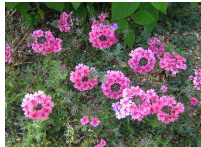
5月7日 駅前広場 バーベナが明るい花を咲かせています。

めて苗作りを体験する花呼さんもいらっしやっただと思いますが、小さなプラグ苗をポットに丁寧に鉢上げしていきました。次回の花作りでは、挿し木をしてみたいと思います。活動とはいえ、きちんと方法をお知らせしますので、初めての方も安心してご参加ください。花呼さんの苗が町中を彩る日も近いかもしれませんね