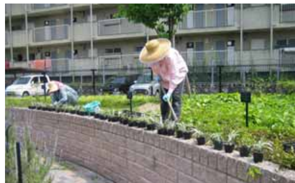
5月8日 丸山やすらぎ広場 コヤブラン シルバードラゴン を植えつけました。

この春、植え替えに利用した植物はすべてハウス産でまかなうことができました！この中には、講習会で作った苗、株分けしたもの、コンテナなどから移植が必要になったものなどありますが、多くが花呼さんの活動によってできたものです。自ら作った苗で花壇作りができた、ということは、本当に素晴らしいことです。5月から【花作り】として種まきなどは活動の一環としましたが、たくさんの方々の参加によりおよそ900個もの苗ができました。初