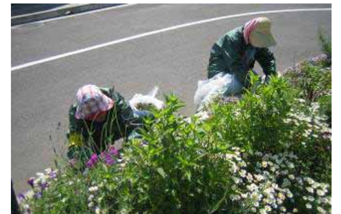
5月12日 鉢伏ふれあい公園 咲き終わりの花を整理しました。

皆さんにお渡ししているポイントカード。昨年の10月からの活動で、いよいよ交換された花呼さんが登場しました！ここで、ポイントについておさらいしましょう。ポイントは活動1時間につき1ポイント。有効期限はありませんので、ご自分のペースでポイントを集めてください。40ポイントで500円相当の園芸用品と交換できます。園芸に関するものであれば、可能な限り用意いたします。皆さんも、何に交換してもらうか、今後の活動の楽しみのひとつに考えておいてください。