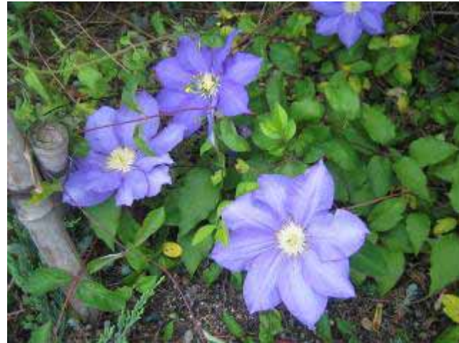
5月7日 駅前広場 クレマチスが涼しげな大輪の花を咲かせていました。

4月後半から5月はじめは日差しがきつい上にお天気が続いて、乾燥気味の花壇もありました。おかげで、冬から活躍したパンジー・ビオラなども傷みが激しくなりました。活動では、選手交代に備えて傷んだ苗を取り除いてもらったり、梅雨に備えて剪定などをしておきました。植え込みを行った花壇では、タイミングよく雨が降ったので、すぐに根付いて元気な花を咲かせていました。6月も植え込み、剪定などをします。どうぞご参加ください！