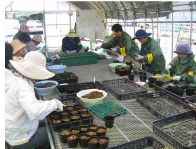
5月21日 花ハウス【花作り】 先月撒いた種の鉢上げを行いました。

めて苗作りを体験する花呼さんもいらっしやっただと思いますが、小さなプラグ苗をポットに丁寧に鉢上げしていきました。次回の花作りでは、挿し木をしてみたいと思います。活動とはいえ、きちんと方法をお知らせしますので、初めての方も安心してご参加ください。花呼さんの苗が町中を彩る日も近いかもしれませんね