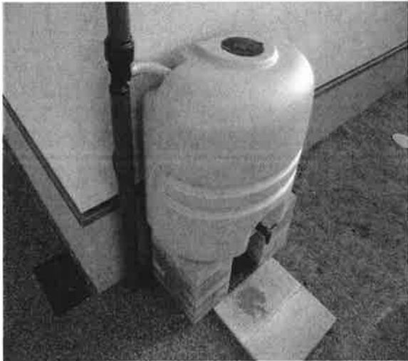
○雨水貯留施設の一例と設置状況

家庭に雨水貯留槽を設置し、降った雨を蓄える施設です。雨水貯留を行うことにより、雨水が一挙に河川に流れ込むのを防ぎ、河川の氾濫等による浸水被害を抑制します。また蓄えた雨水は庭木や花への灌水や打ち水に利用することで水資源の有効利用となります。