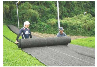
茶の被覆作業の実施