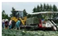
機械化体系の導入