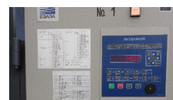
環境制御盤の導入