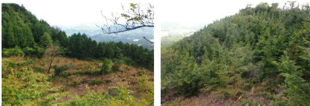
（植栽・下刈りの実施状況）